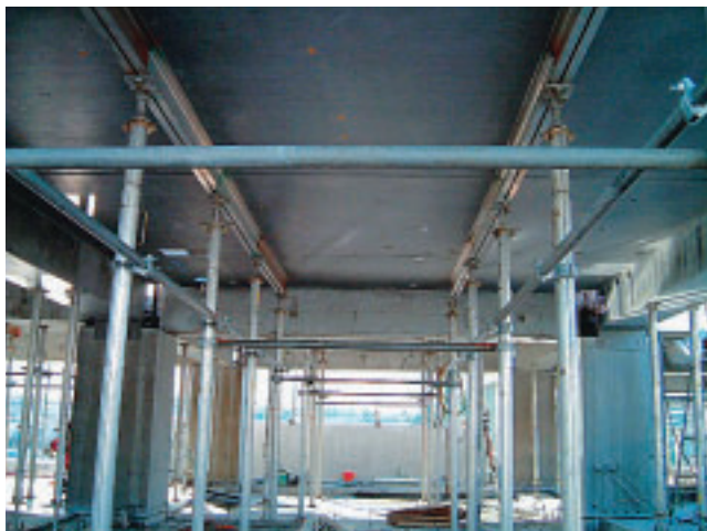
コンクリート製床板受け