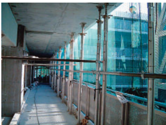
バルコニー取付例