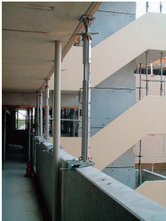
PCaバルコニー受け (PCベース併用)