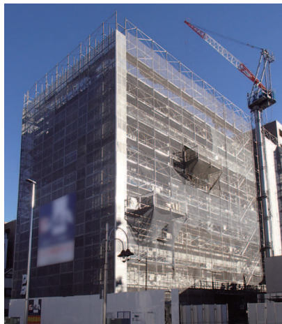
荷受けフォーム RCの型枠工事も効率化