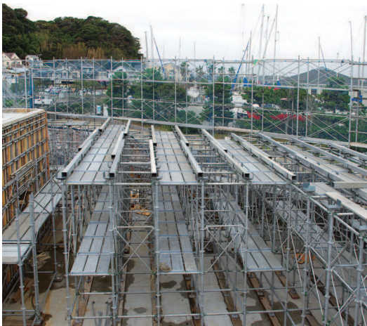
支保工 支保工も手すり先行工法で安全組立て