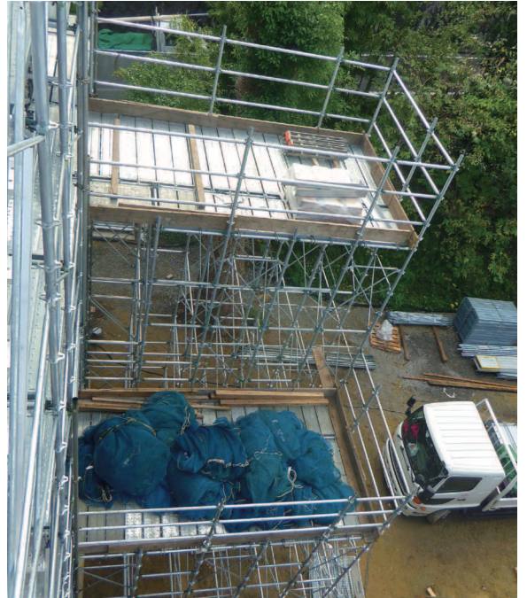
荷取り構台 外部足場と一体のワイドなステージ