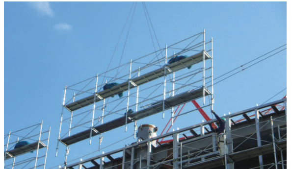
より安全な大組み工法 L3600支柱を用いた2層ブロック