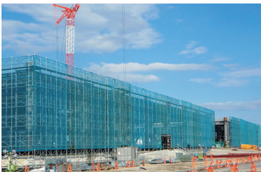
短工期・長大躯体の足場 コストダウンと工期短縮