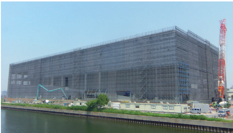
大規模物流センター 最高高さ約40m