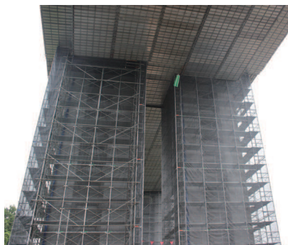
高速道路橋脚 上部工のSKパネルと組合せ使用