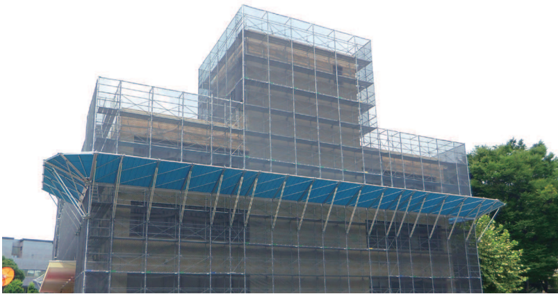
アルミ朝顔 改修工事の車路の落下養生