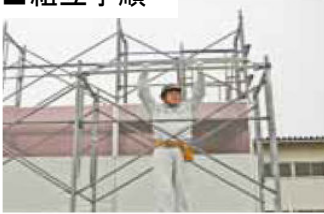
1. 先行手すり枠の上部位置決め金具を枠組の横架材に乗せます。