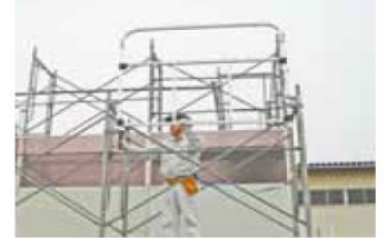
4. 先行手すり枠の下部固定金具にクサビを打ち込んで固定します。もう一方の下部固定金具を同様にクサビを打ち込んでセット完了。