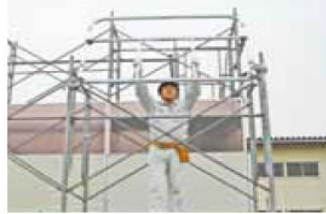
2. 先行手すり枠の下部固定金具が枠組の脚柱にセットできる位置まで半転させます。